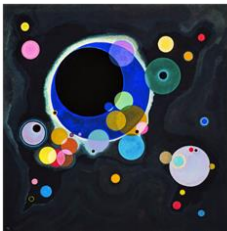
Wassily Kandinsky - Diversos Círculos 323 - 1926

Podemos ainda classificar a arte abstrata em outras duas, Abstração Geométrica e Abstração Informal, de acordo com as formas apresentadas nas obras.