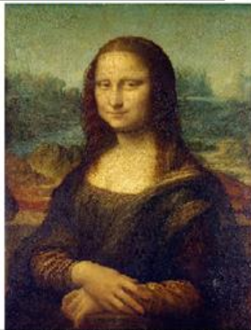
5- MONA LISA (1503-06), DE LEONARDO DA VINCI