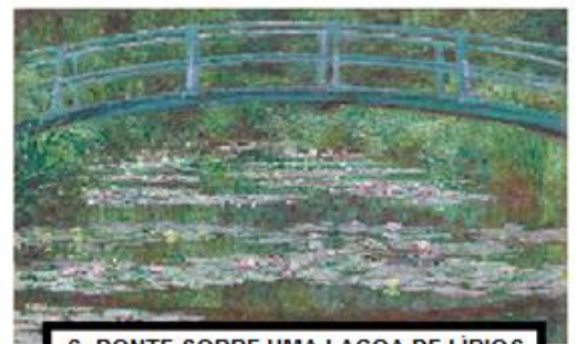
6- PONTE SOBRE UMA LAGOA DE LÍRIOS DE ÁGUA (1899), DE MONET