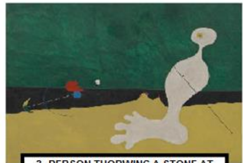
3- PERSON THORWING A STONE AT A BIRD (1926), DE JOAN MIRÓ