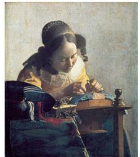
Veermer - A rendeira (1669-1670)

O Renascimento, o Barroco e o Realismo são bons exemplos de estilos artísticos onde o figurativo realista, a capacidade de mimese (imitação) do pintor contava muito.