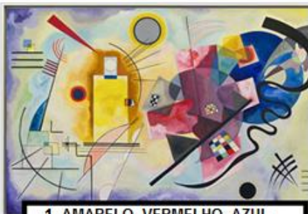
1- AMARELO- VERMELHO- AZUL (1925), DE WASSILY KANDINSKY